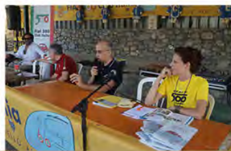
TAVOLA ROTONDA / TALK SHOW

Dalle 10.30/From 10.30am Parco Villafranca