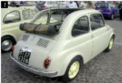
■ 1) Una Fiat 500 prima serie; 2) il logo del Cinquantenario