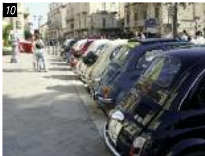
9) Fasano, Vittorio Bernasconi 10) Terlizzi, le auto in piazza; 11) Terlizzi, i piccoli ballerini della Scuola "don P. Pappagallo" si esibiscono in Piazza Cavour fra le 500

Per finire la carrellata di manifestazioni pugliesi, a Terlizzi domenica 28 maggio si è svolto il 3° Raduno Città dei Fiori. I fiori, esportati in mezza Europa, sono infatti diventati uno dei cardini dell'agricoltura locale, accanto alla più antica tradizione olivicola, che vede la realizzazione di pregiate miscele delle diverse varietà. In questa cittadina di origi-