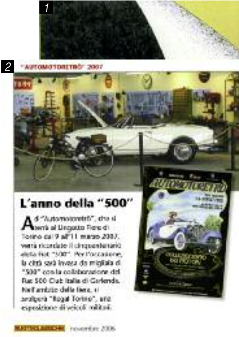
MATTEO GIACOBBE novembre 2006