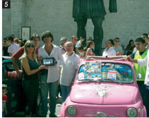
■ 4) il momento della benedizione degli equipaggi da parte del parroco; 5) i Fiduciari per la foto ricordo