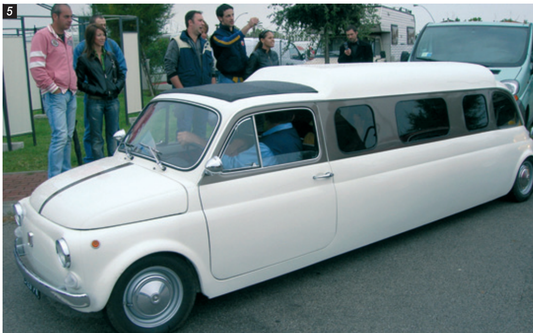
■ 5) La 500 in versione limousine lunga oltre cinque metri; 6) la Presidente Silvia Depaoli mentre si accinge a scendere dalla lunga vettura

contro ed i partecipanti non hanno avuto la possibilità di godere pienamente della giornata all'aria aperta.