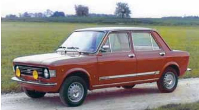
▲ Moretti 128 Lusso. ▶ Moretti 127 Lusso.