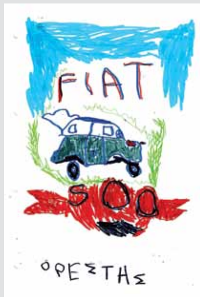
La 500 vista da Oreste , il figlio di Stathis Vlahakos (nostro fiduciario di Atene). Il papà dipinge e buon sangue non mente...