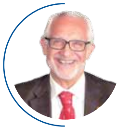
di Renato Donati