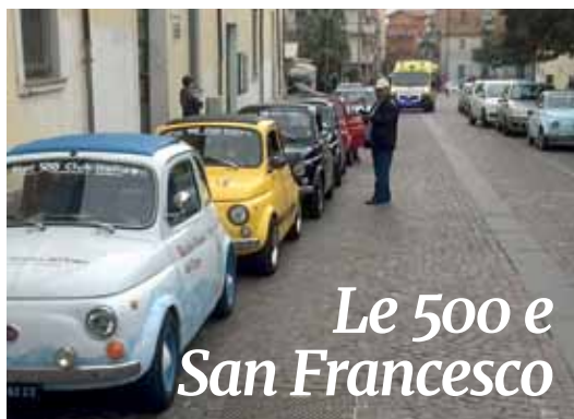
Le 500 e San Francesco