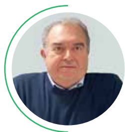
di Enrico Bo