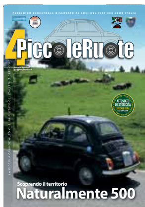
Copertina: La 500 nei paesaggi Balcani: foto di Gianluca Fiorentini On the cover: The Fiat 500 in the Balkans: photo of Gianluca Fiorentini