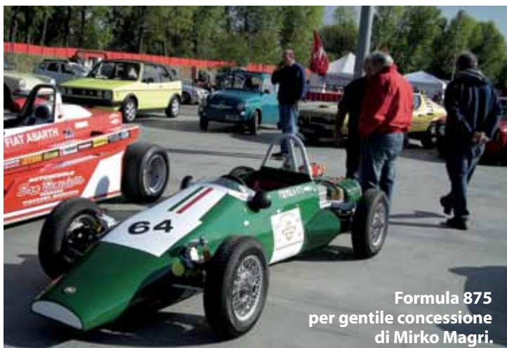
Formula 875 per gentile concessione di Mirko Magri.