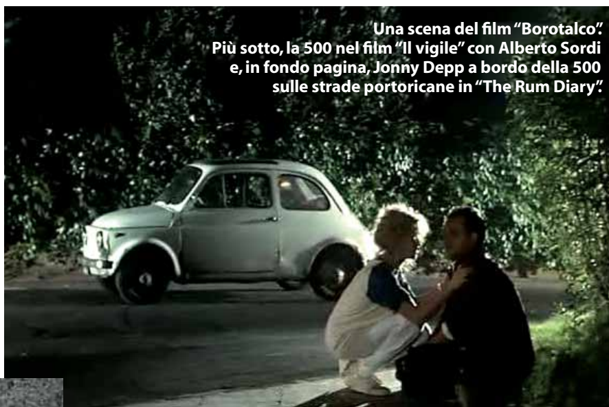
Una scena del film "Borotalco". Più sotto, la 500 nel film "Il vigile" con Alberto Sordi e, in fondo pagina, Jonny Depp a bordo della 500 sulle strade portoricane in "The Rum Diary".