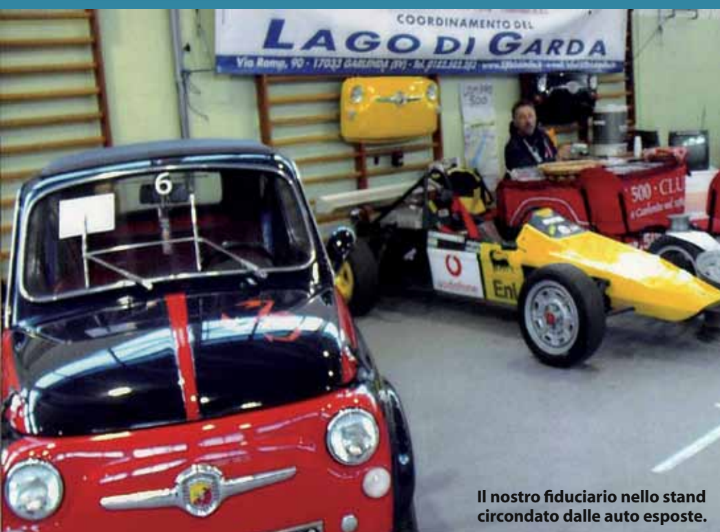
Il nostro fiduciario nello stand circondato dalle auto esposte.