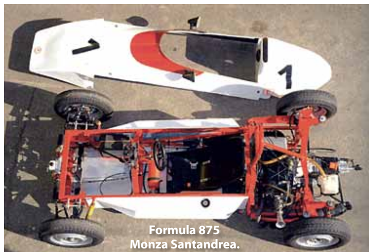
Formula 875 Monza Santandrea.