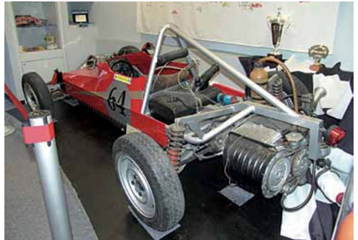
Formula 875 Monza Repetto, nella pagina a fianco, da sinistra: prima, durante e dopo il restauro. Nell'ultima foto, sopra a destra, vediamo l'auto esposta al museo Multimediale Dante Giacosa.