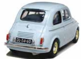
« Steyr-Puch 500 D »

L'éditeur De Agostini , avec la collaboration de Brumm , a diffusé directement la collection « Storia di un mito: la Fiat 500 », composée de 30 sujets parmi lesquels citons la Fiat 500 S Moretti 1962, la 500 Sport Zagato 1957, la Steinwinter 250 de 1974, la Steyr Puch 500 1957 et la 650 TR 1964.