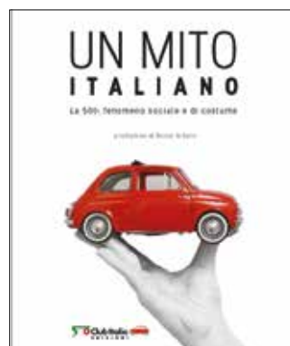
« Couverture et pages extraites du livre »

cartonnée, pour un prix de 15 €, vous pouvez acheter directement l'ouvrage auprès du Fiat 500 Club Italie : www.500clubitalia.it