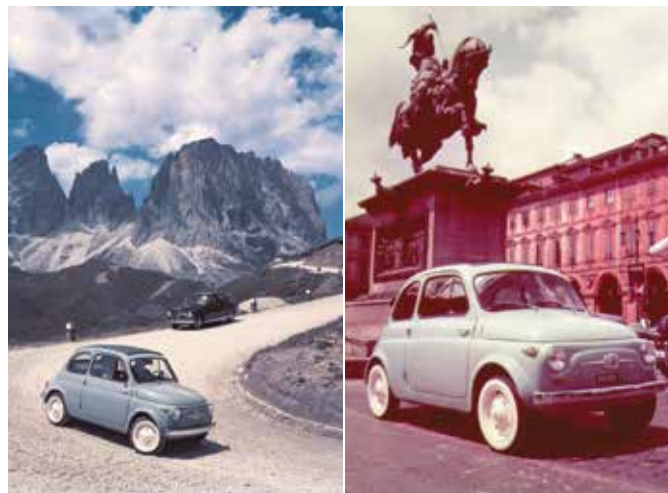
« Nuova 500 1957 »

celui de sa sœur, la 600. La Fiat a rapidement remédié aux soucis de naissance, en proposant une variante mieux finie et équipée, dite « normale » et en réduisant le coût de la version de base dite « economica ». La différence de tarif avec le modèle initial a alors été remboursée par Fiat avec un chèque donné aux premiers acheteurs.