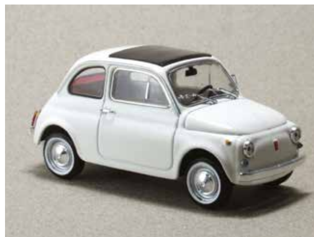
« 500 L au 1/43 e »

La collection de Fabbri , vendue en kiosque sous le titre « Quattoruote Collection », a proposée au 1/24 e une jolie 500 F avec capot moteur, compartiment à bagages avant et portières ouvrantes.