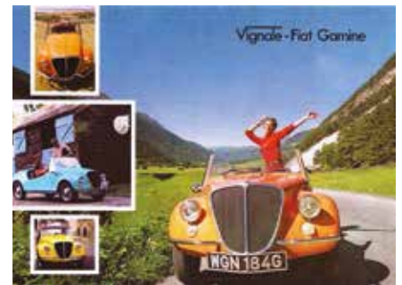
« Vignale Gamine »

En ce qui concerne les autres variantes, je citerai la 500 My Car du carrossier Francis Lombardi qui se caractérise par le toit entièrement métallique, la Gamine de Vignale avec une carrosserie qui rappelle celle des roadsters d'antan comme la Balilla sport et le Ferves Ranger qui était un agréable et petit tout-terrain avec la mécanique de la 500.