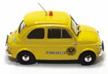
« Steyr-Puch OAMTC »