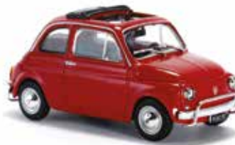
« 500 L de Starline »

Dans la liste des miniatures réussies au 1/43 e , citons encore la 500 avec toit ouvrant de 1959 signée Solido ; la Nuova 500 economica de Norev pour la collection Fiat Story de Hachette ; les 500 L de Starline , Cararama et Minichamps . Norev a aussi diffusé un coffret qui célébrait les 50 ans de la Fiat 500 avec la 500 normale et l'actuelle, les deux au 1/43 e .