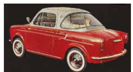
« NSU-Fiat 500 Weinsberg coupé »