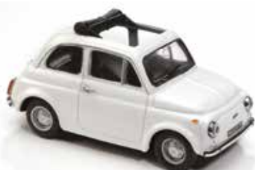
« 500 R »