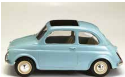
« 500 F »

L'Italienne Pocher , au 1/13 e , a bien miniaturisé en plastique les Fiat 500 F et 500 L.