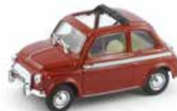
« 500 S Moretti »

L'éditeur De Agostini , avec la collaboration de Brumm , a diffusé directement la collection « Storia di un mito: la Fiat 500 », composée de 30 sujets parmi lesquels citons la Fiat 500 S Moretti 1962, la 500 Sport Zagato 1957, la Steinwinter 250 de 1974, la Steyr Puch 500 1957 et la 650 TR 1964.