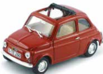
« Steinwinter 250 »