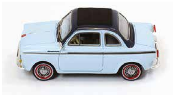
« NSU-Fiat 500 Weinsber Limousette, Premium-X, 1/43e »

et Steyr Puch 650 T n'a pas eu une longue vie. Les modèles étaient très réalistes et fourmillant de détails, disponibles en kit et assemblés.