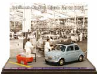
« Chaîne de montage dans l'usine de Mirafiori en 1959 avec Nuova 500 toit ouvrant »