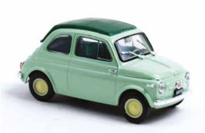
« Nuova 500 "economica" »