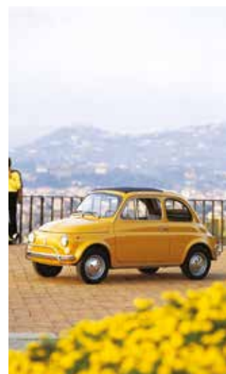
« 500 L »