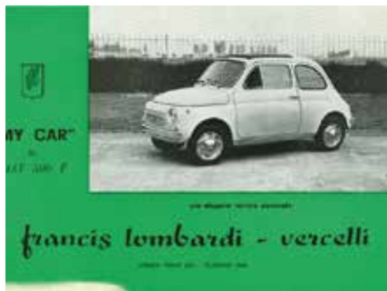
« 500 My Car Francis Lombardi »

localement. La NSU-Fiat produit la 500 Weinsberg dans les variantes limousette et coupé, qui, tout en conservant la mécanique originale, utilise une carrosserie différente de celle de la Fiat.