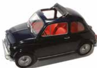
« 500 L »