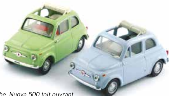
« à gauche, Nuova 500 toit ouvrant Dinky Toys et, à droite, Vitesse, 1/43 e . Le moule est identique »

1965, la 500 L de 1968, la 500 R de 1972, la 500 Sport de 1958 et la Steyr Puch 650 T 1962. L'interprétation est bonne et comprend une reproduction exacte de l'intérieur. L'utilisation des nuances de couleurs est fidèle à celle des teintes originales.