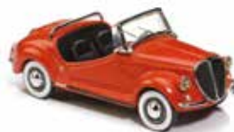
« Vignale Gamine Miniacar's 43 »