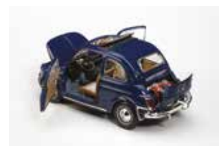
500 L au 1/18 e »

Domage que dans la série plus récente et dans celle distribuée par Maisto, la couleur des jantes des roues soit ivoire au lieu de gris argenté.