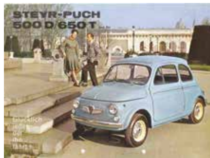
« Steyr-Puch 500 D »