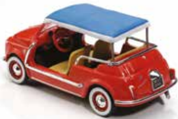
« Nuova 500 Jolly Ghia »