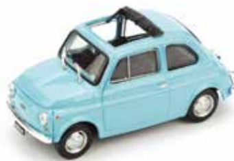
« 500 R »