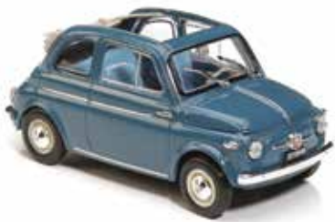
« Nuova 500 "normale" »

Sport, présente dans le catalogue avec les variantes de toit ouvrant en toile et en métal, sans oublier la 500 dédiée aux Etats-Unis.