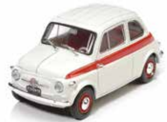
« Nuova 500 Sport »

Quelques années plus tard, la maison d'édition Hachette lance la collection Fiat 500 Story avec 45 modèles différents au 1/43 e produits par Universal Hobbies , racontant l'évolution de la petite Fiat.