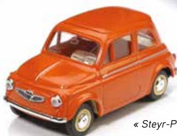
« Steyr-Puch 650, Vitesse, 1/43 e »