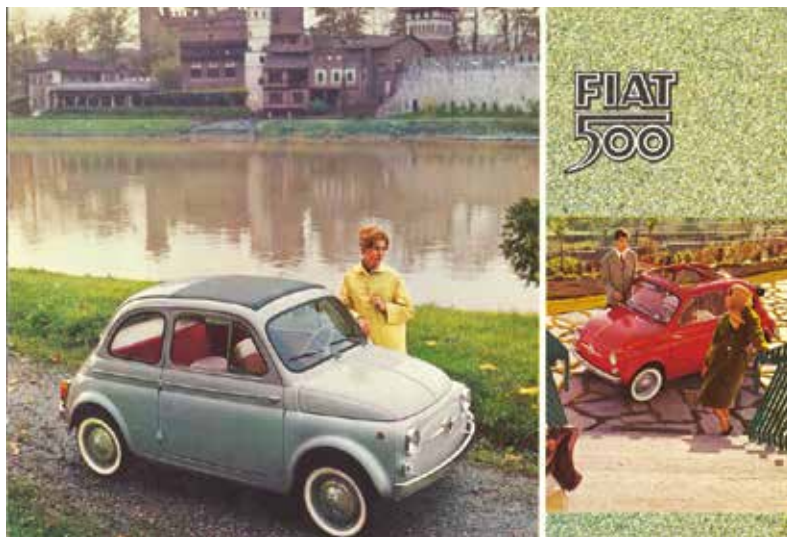
« 500 toit ouvrant et 500 trasformabile fin 1959 »

En 1958, Fiat commercialise la 500 Sport, qui se distingue, à l'extérieur, par une couleur gris clair, une bande latérale rouge, le toit qui peut être en toile ou tout métal. Techniquement, elle dispose d'un moteur de cylindrée légèrement augmentée et significativement plus puissant. Avec le passage du temps le moteur de la Nuova 500 prendra du muscle.