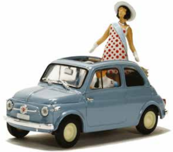
« Présentation, à Turin, de la Nuova 500 durant l'été 1957 »

L'Italienne Pocher , au 1/13 e , a bien miniaturisé en plastique les Fiat 500 F et 500 L.