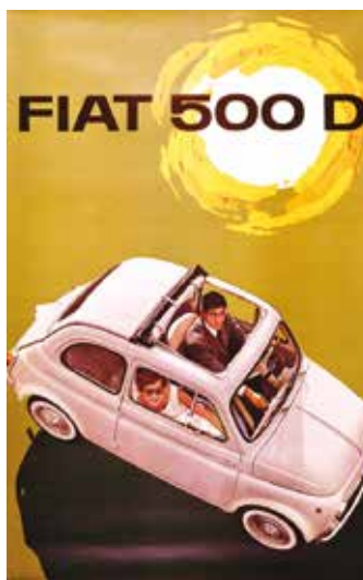
« 500 D »