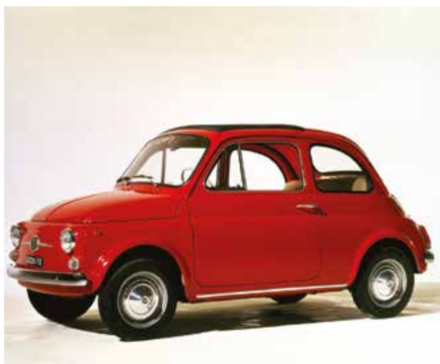
« 500 F »

La percée dans les ventes a enfin lieu en 1960 avec la 500 D qui hérite du moteur de la 500 Sport dégonflé (sortie de la production à la fin des années 1960). Ce moteur gagne en performance. En fait, le très connu magazine italien Quattoruote chronomètre la 500 D à une vitesse de 103 km/h, seulement 4 km/h de moins que celle mesurée par le même magazine lors du test de la Fiat 600 D.