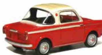
« NSU-Fiat 500 Weinsberg coupé, BoS-Models, 1/43 e »