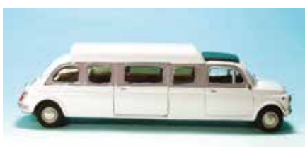
« 500 Limousine, MG Model Plus »