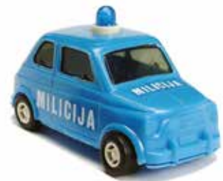
« 500 Milijcia, produite en Yougoslavie, 1/32 e »