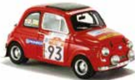
« 500 R Rallye di Sanremo 1982, Arena Models »