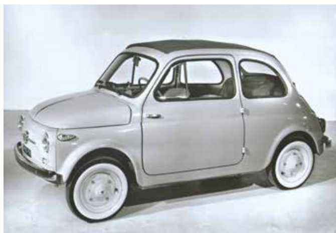
« Nuova 500 1957 »