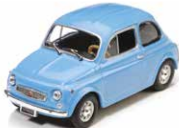
« 500 My Car de Francis Lombardi »