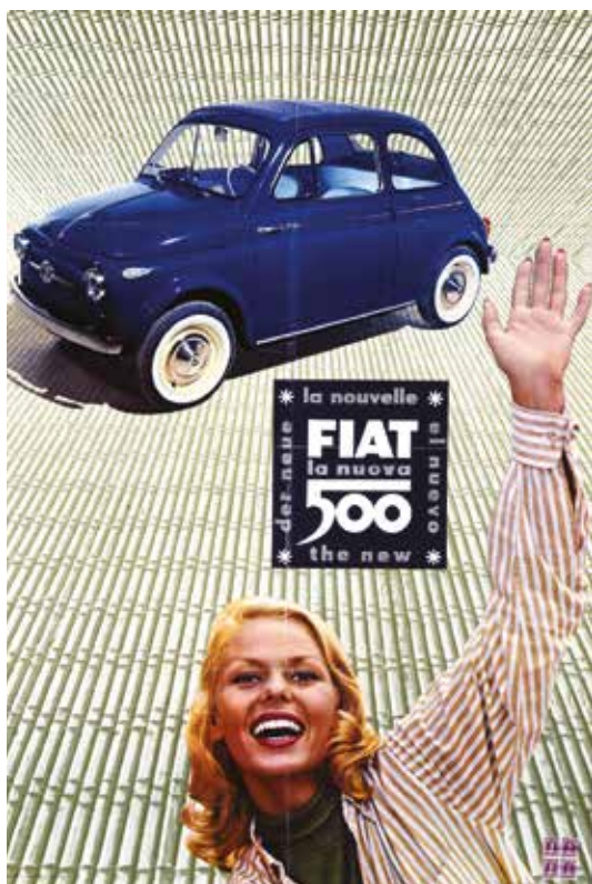
« 500 "normale" »

En 1958, Fiat commercialise la 500 Sport, qui se distingue, à l'extérieur, par une couleur gris clair, une bande latérale rouge, le toit qui peut être en toile ou tout métal. Techniquement, elle dispose d'un moteur de cylindrée légèrement augmentée et significativement plus puissant. Avec le passage du temps le moteur de la Nuova 500 prendra du muscle.