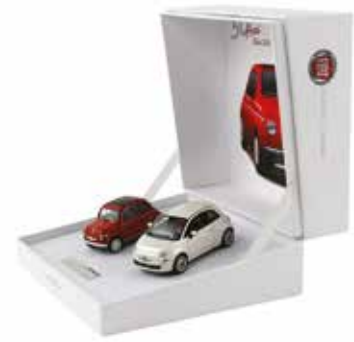
« Coffret Norev »