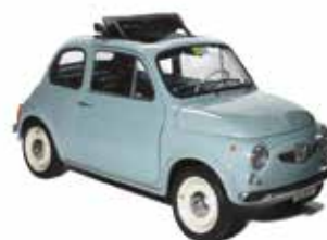
« Steyr-Puch 650 T »

Récemment, la maison d'édition Hachette a mis en vente en Italie un modèle 500 F à l'échelle 1/7 e en métal, fabriqué par l'italienne Leoni , qui est vendu en Italie, dans les kiosques en pièces à assembler et qui est riche en détails réalistes.