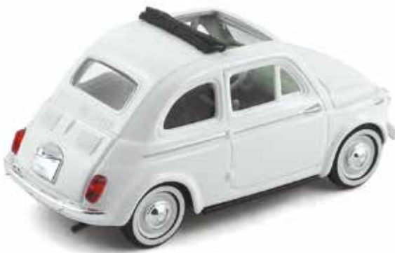
« Nuova 500 toit ouvrant, Solido »