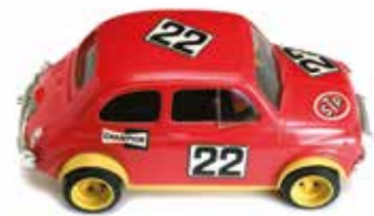
« 500L Rallye »