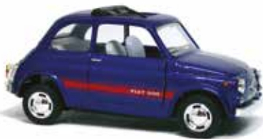
« 500 F, Kinsmart, 1/32 e »