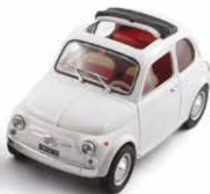
« De gauche à droite, Fiat 500 D de la collection Auto Vintage de Hachette et 500 F de Leoni pour la collection Quattroruote Collection » de Fabbri, toutes les deux au 1/24 e en métal »