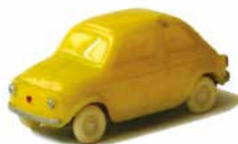
« Nuova 500, Pocher, 1/87 e »

Au rang des petites échelles, citons la 500 F de Minichamps , la Nuova 500 toit ouvrant de IMU , la 500 F de Schuco Piccolo , la 500 F de Busch , la 500 F de Grisoni , la Nuova 500 1957 de Pocher .