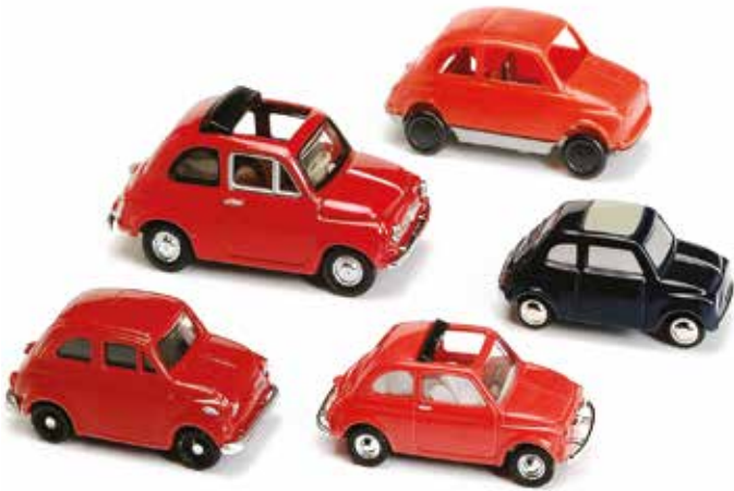
« De gauche à droite, dans le sens des aiguilles d'une montre : Nuova 500 toit ouvrant IMU, 500 F Minichamps, 500 F Grisoni, 500 F Schuco Piccolo, 500 F Busch »

La presque totalité des variantes de la Fiat 500 ont été déclinées, mais l'une d'elles pas encore: la 500 transformable, produite de 1959 au printemps 1961, qui a adopté de nouveaux