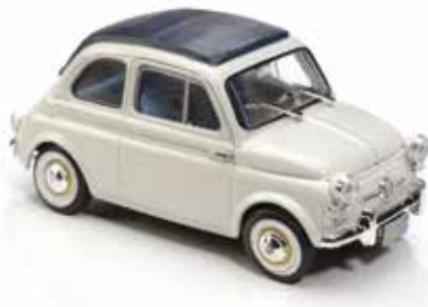
« Nuova 500 USA »