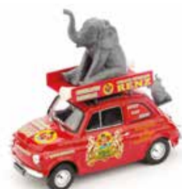
« 500 Circus Herman Renz »