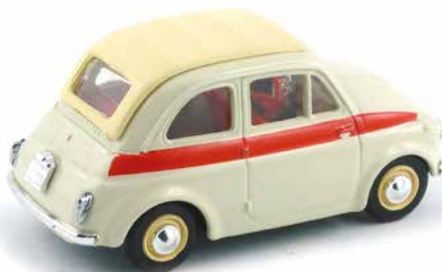
« Nuova 500 Sport, Vitesse, 1/43 e , peu courante avec le toit entièrement ouvrable »