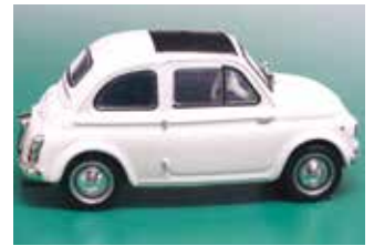
« 500 D, collection Les Classiques de l'Automobile de Hachette et Autoplus, 1/43 e »