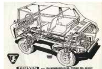
« Ferves Ranger »

En ce qui concerne les autres variantes, je citerai la 500 My Car du carrossier Francis Lombardi qui se caractérise par le toit entièrement métallique, la Gamine de Vignale avec une carrosserie qui rappelle celle des roadsters d'antan comme la Balilla sport et le Ferves Ranger qui était un agréable et petit tout-terrain avec la mécanique de la 500.