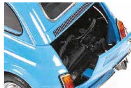
« 500 L au 1/18 e »