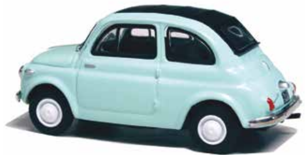
« Nuova 500 Economica Norev pour la collection Hachette, Fiat Story de Hachette 1/43 e »

Du côté des modèles artisanaux, citons, au 1/43 e , les 500 F et L du japonais Ebbro , les 500 Economica, Sport, F, L, 500 Jolly Ghia et Vignale Gamine de Spark , la 500 Limousine de MG Model Plus , la 500 R Rallye de San Remo 1982 de Arena Models , la 500 L de C.B. , la NSU Fiat 500 coupé Weinsberg de Bos-Models et la Vignale Gamine de Miniacar's 43 .