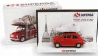
« 500 promotionnelle pour Superga, bien connue pour ses chaussures italiennes en toile, Brumm, 1/43 e »