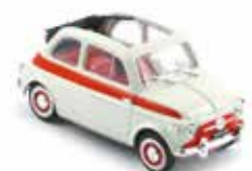
« 500 Sport Zagato »