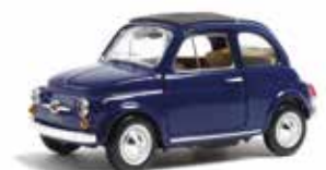
« 500 F au 1/24 e »