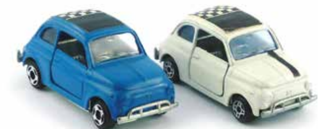
« À gauche, 500 L Polistil et, à droite, 500 L Politoys, 1/43 e »

Mercury a intégré dans son programme une reproduction au 1/43 e du sympathique véhicule tout-terrain Ferves Ranger.