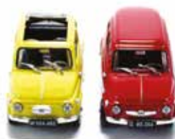
« De gauche à droite, Steyr-Puch 500 et 650 TR »