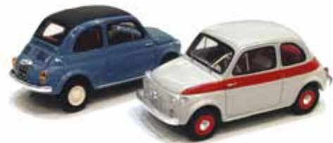
« De gauche à droite, Nuova 500 "economica" et 500 Sport, Spark »

Du côté des modèles artisanaux, citons, au 1/43 e , les 500 F et L du japonais Ebbro , les 500 Economica, Sport, F, L, 500 Jolly Ghia et Vignale Gamine de Spark , la 500 Limousine de MG Model Plus , la 500 R Rallye de San Remo 1982 de Arena Models , la 500 L de C.B. , la NSU Fiat 500 coupé Weinsberg de Bos-Models et la Vignale Gamine de Miniacar's 43 .