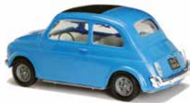
« 500 L »