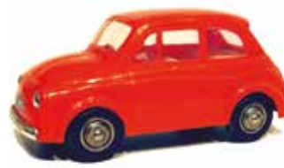
« Steyr-Puch 500, Gowi, 1/24 e »

feux arrière et des phares préconisés par le nouveau code de la route, tout en maintenant le toit entièrement en toile et l'absence des enjoliveurs des roues.